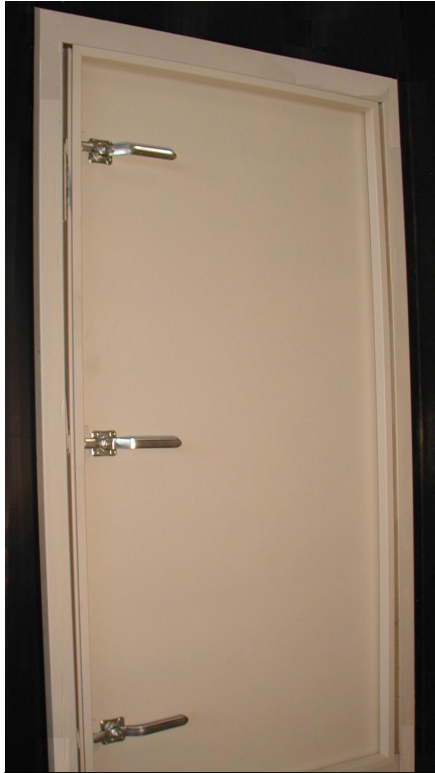
3 Presshebelverschlüsse einseitig bedienbar