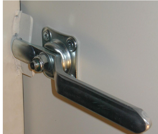
Presshebel auf der Bandgegenseite